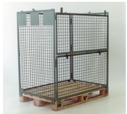
Normgitter 2529, Füllhöhe 1200 mm Cadre grillagé normalisé, hauteur de remplissage 1200 mm