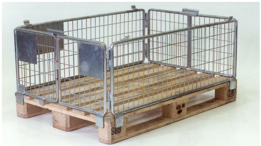
Normgitter 2525 RM, Füllhöhe 400 mm Cadre grillagé normalisé 2525 RM, hauteur de remplissage 400 mm