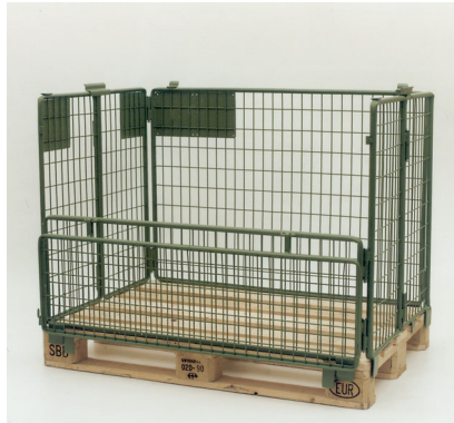
Normgitter 2527 RM, Füllhöhe 800mm Cadre grillagé normalisé 2527 RM, hauteur de remplissage 800 mm