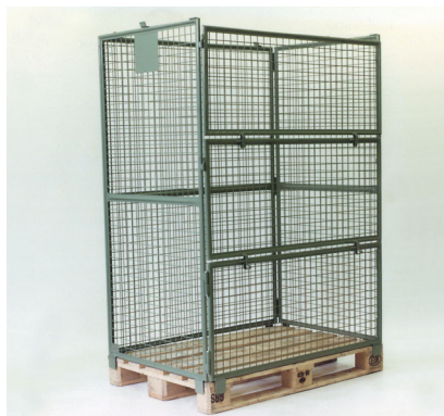
Aufsetzgitter mit 2-fach abklappbarer Längswand Cadre grillagé avec paroi longitudinale rabattable en deux parties