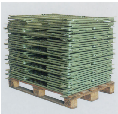
Normgitter 2527 RM, zusammengeklappt und auf Palette gestapelt Cadres grillagés normalisés 2527 RM, repliés et déposés sur une palette

L'ensemble est phosphaté et plastifié. La polymérisation s'effectue au four à 220° C. Couleur verte RAL 6011 ou selon demande. Exécutions promatisées ou zinguées à chaud disponibles.