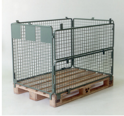
Normgitter 2527, Füllhöhe 800 mm Cadre grillagé normalisé 2527, hauteur de remplissage 800 mm

Les grillages peuvent être adaptées à vos besoins. Les grillages destinées au stockage de bouteilles sont munis de crochets de sureté pour retenir la charge sur la palette.