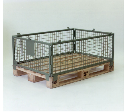
Normgitter 2525, Füllhöhe 400 mm Cadre grillagé normalisé 2525, hauteur de remplissage 400 mm