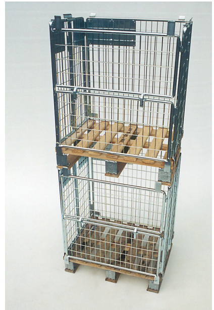
Aufsetzgitter 2517 RM, gestapelt, eine Längswand zur Hälfte abklappbar Cadre grillagé 2517 RM, superposé, un côté longitudinal est rabattable sur la moitié de la hauteur